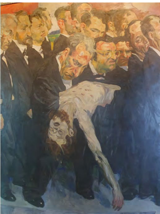
Abb. 7: Der tote Robert Blum, Szene aus GRÜTZKE, Der Zug der Volksvertreter.

Sind die Abgeordneten in steter Bewegung gezeigt, scheinen sie in einer Szene kurz ins Stocken zu geraten: Gezeigt ist der tote ›Robert B.‹. Robert Blum wird als nackter Leichnam dargestellt, dessen bärtiges Gesicht, der Körper mit Wundmalen und die Positionierung im Bild in den Armen zweier Abgeordneter deutliche Analogien an die Christus-Ikonographie erkennen lässt.