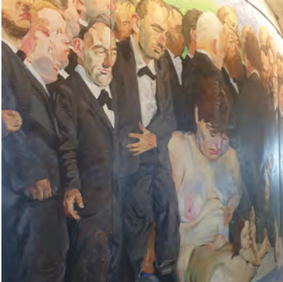
Abb. 4, 5 u. 6: Paulskirchenabgeordnete und ›ihr‹ Volk, Szenen aus GRÜTZKE, Der Zug der Volksvertreter.

che Beziehungen zu ›ihrem‹ Volk erkennen lassen, das durch die bunte Farbgebung, teils auch Nacktheit, und durch die Platzierung im unteren Bildmittel von den Abgeordneten unterschieden ist. Vielfach scheinen die Parlamentarier über das Volk hinwegzuschreiten, dessen Hinwen-