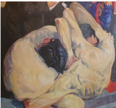
Abb. 11: Ringer, Szene aus GRÜTZKE, Der Zug der Volksvertreter.