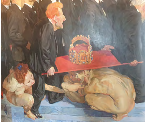
Abb. 9 u. 10: Paulskirchenabgeordnete tragen dem preußischen König die Krone an, Szene aus GRÜTZKE, Der Zug der Volksvertreter.