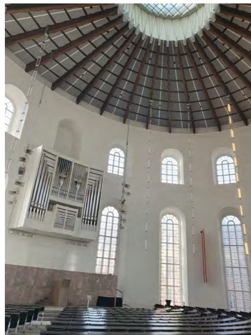
Abb. 8: Tagungsraum des Paulskirchenparlaments heute.

Während sich die ersten beiden Podcastfolgen Blum selbst widmen, betrachtet Folge 3 das »Nachleben« der Revolution, wie das Festhalten der Mehrheit der Paulskirchenabgeordneten an einer konstitutionellen Monarchie – während Blum zu der Minderheit gehörte, die für eine demokratische Republik eintrat –, die Entscheidung für eine kleindeutsche Lösung, die ablehnende Reaktion des preußischen Königs darauf,