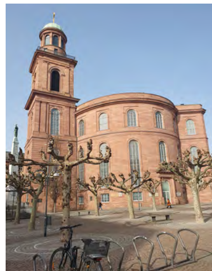
Abb. 2: Paulskirche Frankfurt.

Nationalversammlung in der Frankfurter Paulskirche auch das Scheitern der Revolution und ihre Auswirkungen in den Blick und zeichnet rund 175 Jahre deutsche Demokratiegeschichte nach. Ein besonders origineller Zugriff ist, dass übergeordnete Fragen mit der Person, dem Werdegang und Schicksal von Robert Blum verknüpft, adressiert werden und dabei als Ausgangspunkt das Gemälde »Der Zug der Volksvertreter« dient, das 1991 in der Wandelhalle der Frankfurter Paulskirche angebracht wurde. 1