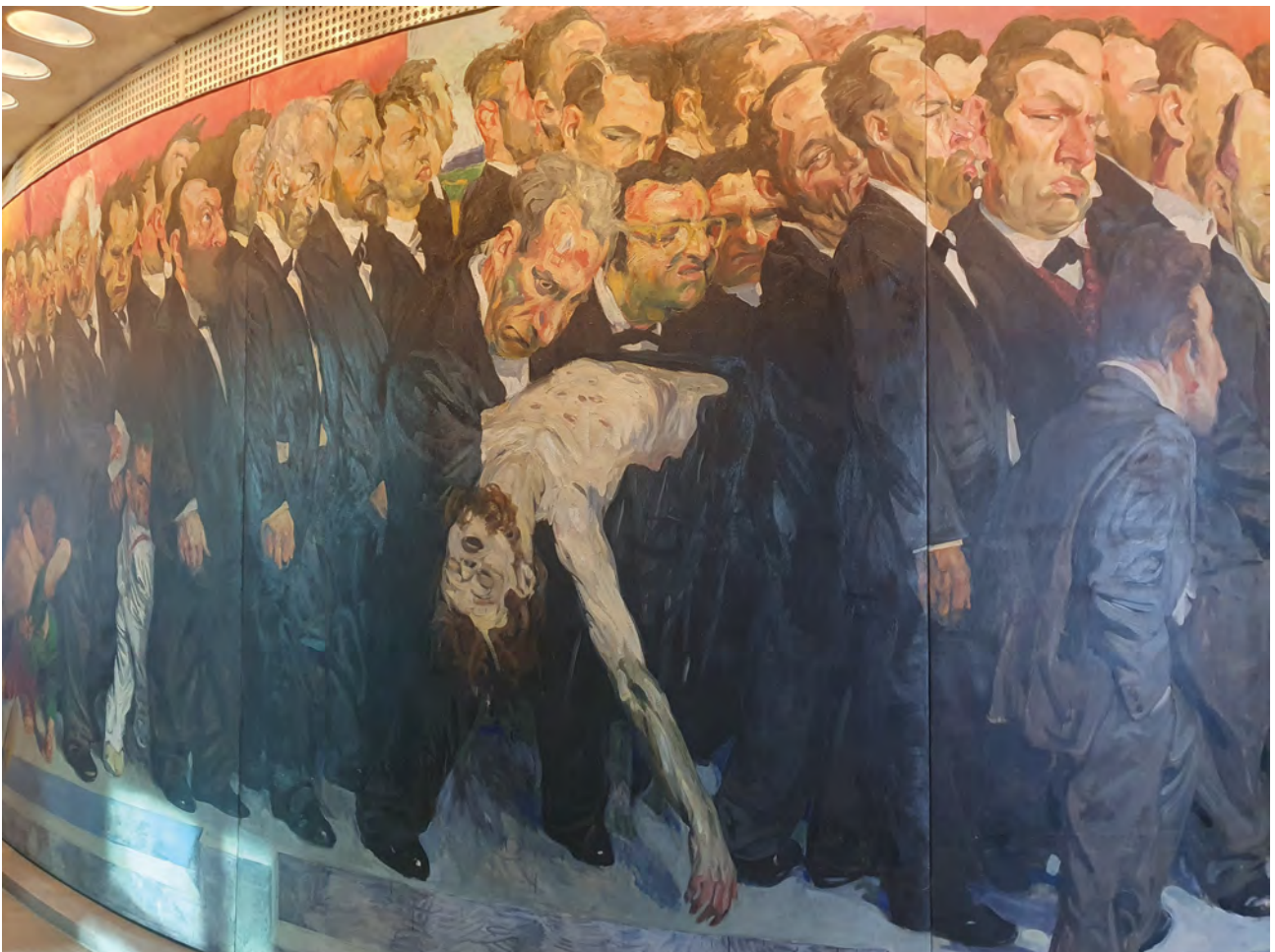
Abb. 1: Der tote Robert Blum in den Armen von Abgeordneten des Paulskirchenparlaments, Szene aus JOHANNES GRÜTZKE, Der Zug der Volksvertreter, 1989/1990. 1991 angebracht in der Wandelhalle der Frankfurter Paulskirche.