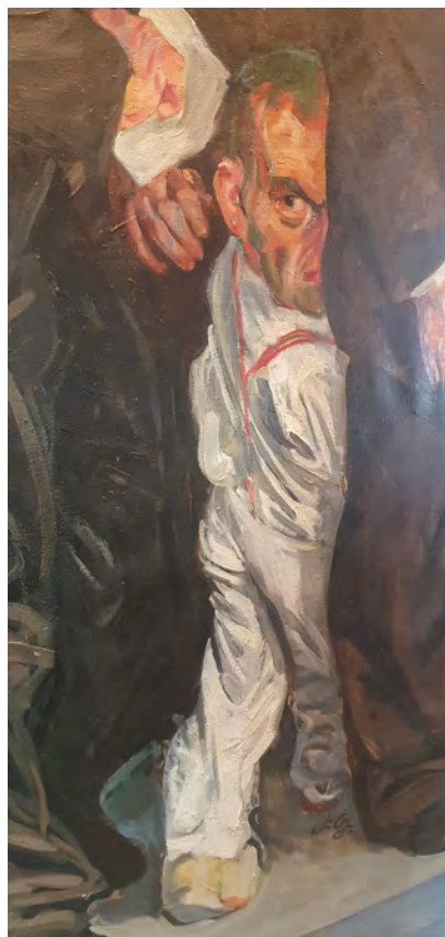
Abb. 3: Mutmaßliches Selbstporträt Grützkes, Ausschnitt aus GRÜTZKE, Der Zug der Volksvertreter.

Das monumentale Gemälde fertigte der Berliner Künstler Johannes Grützke (* 30. September 1937, Berlin; † 17. Mai 2017, Berlin) zwischen 1989 und 1991 in seinem Berliner Atelier, nachdem er 1987 sich bei dem von der Stadt Frankfurt ausgeschriebenen Wettbewerb für eine Wandbildgestaltung in der Paulskirche gegen u. a. Jörg Immendorff und A. R. Penck durchgesetzt hatte. Grützke war nicht nur ein vielseitig begabter Künstler, der als Maler, Zeichner, Grafiker und Medailleur sowie Bühnenbildner arbeitete, sondern auch Mitbegründer und wichtiger Exponent der Schule der neuen Prächtigkeit. Sein ganz eigener figurativer Stil, der durch die ironisch-groteske Überzeichnung der Dargestellten geprägt ist, zeigt sich auch in den verschiedenen, auf 14 Leinwänden aufgetragenen Szenen des 32 Meter breiten und drei Meter hohen umlaufenden Wandfries in der Paulskirche. Grützke kombinierte teils historisch, teils zeitgenössisch und teils allegorisch inspirierten Szenen zu einem monumentalen Rundbild. Grützke gestaltete die Gesichter bewusst so, dass sie (unwillkürlich) bekannt erscheinen, ohne dass sich dies stets eindeutig in der Zuweisung einer konkreten historischen Person auflösen lässt.