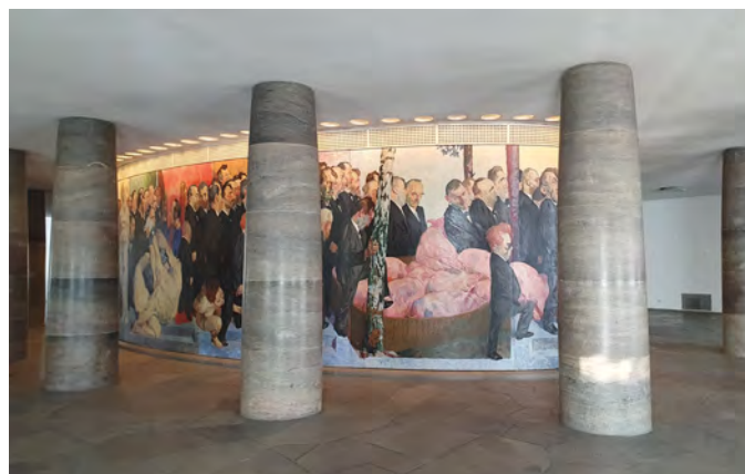
Abb. 12: Blick in die Wandelhalle der Paulskirche mit GRÜTZKE, Der Zug der Volksvertreter.

Abrufbar sind die fünf Folgen des sehr hörenswerten Podcasts unter: https://www.stadtgeschichte-ffm.de/de/stadtgeschichte/podcasts oder auch https://paulskirche-was-geschah-mit-robertb.podigee.io . (ASG)