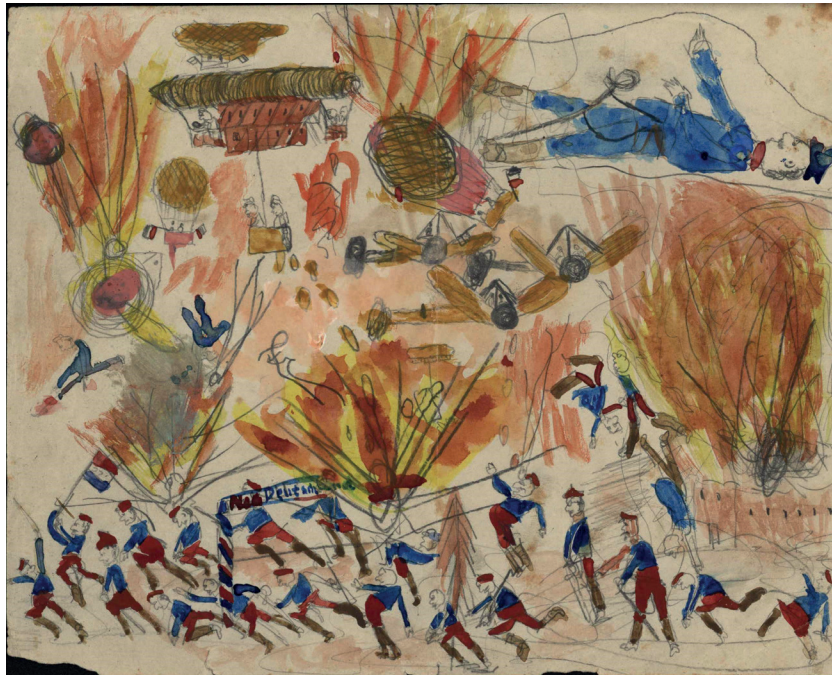
Abb. 2: ERNST HOPP, Szenen Erster Weltkrieg, Tuscheskizze auf Papier, 21,5 x 17,5 cm, 1915/1916. IPG-Signatur: Hss / Kapsel / 1.

Das Institut für Personengeschichte wollte und durfte zu diesem außergewöhnlichen Bildangebot seinen eigenen Beitrag leisten (vgl. die Wiedergabe des Verleihungsschreibens, hier Abb. 1). Er wusste offenbar so zu überzeugen, dass die UNESCO sogar unlängst, als sie alle 2025 neu in das Weltdokumentenerbe-Programm aufgenommenen Projekte kurz vorstellte, für dasjenige zu den »Drawings and writings of children during wartime in Europe« zur Veranschaulichung eigens ein Motiv aus unserem IPG-Bestand wählte: https://www.unesco.org/en/memory-world/register2025?hub=1081