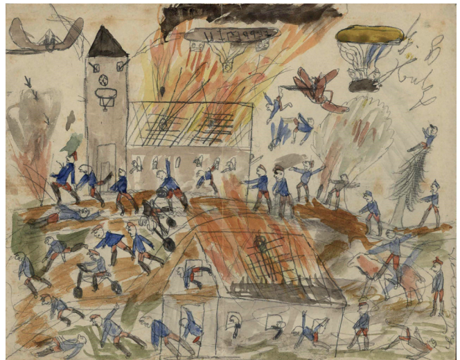
Abb. 7: ERNST HOPP, Szenen Erster Weltkrieg, Tuscheskizze auf Papier, 21,5 x 17,5 cm, 1915/1916.