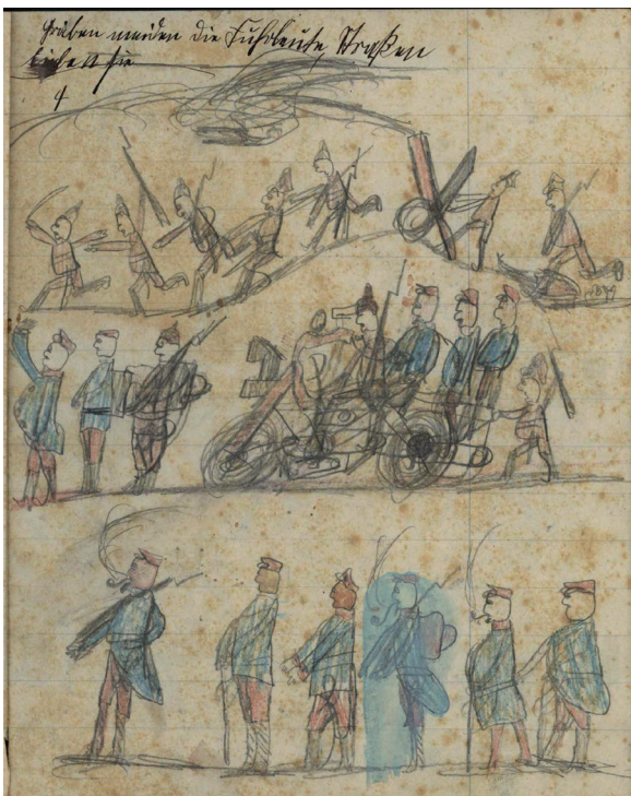
Abb. 4: ERNST HOPP, Szenen Erster Weltkrieg, Bleistiftzeichnung auf Papier, 21,5 x 17,5 cm, 1915/1916.

In seinen so bis zum Frühjahr 1916 entstandenen zehn farbigen Tuschskizzen und acht Bleistiftzeichnungen hat Ernst Hopp sein persönliches Miterleben des Ersten Weltkrieges ausgedrückt. Dabei zielte sein Blick auf West- wie Ostfront. In charakteristischen Uniformen zeichnete und kolorierte er deutsche, französische und russische Soldaten inmitten des Kampfgeschehens, gelegentlich auch im Alltag abseits der Front (Abb. 4): »vor der Schlacht wo es noch schön ist« (Abb. 5).